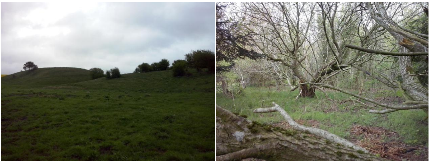
Figur 1: Til venstre ses overdrev og enge i Saltum Bjerger og til højre ses en af skovene.

Udover de lysåbne naturarealer er der også flere skove og krat. Her er der en forholdsvis stor diversitet i arterne og samtidig er områderne flere steder forholdsvis urørt. Dette er med til at give en stor biodiversitet, samt gode føde og levevilkår for vildtet i området.