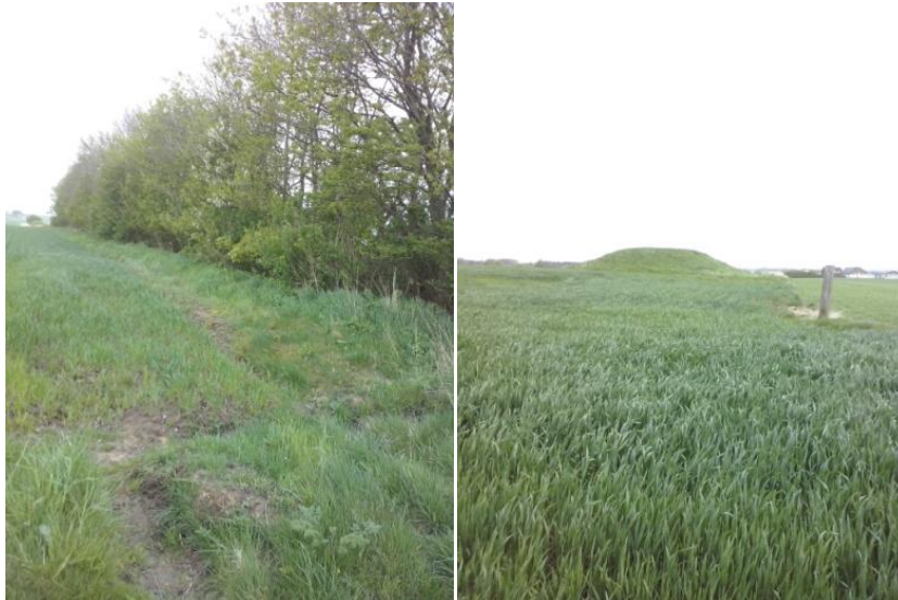
Figur 2: Det ene dige samt gravhøjen.